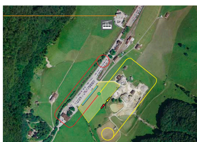
A1 GS Wasserlauben