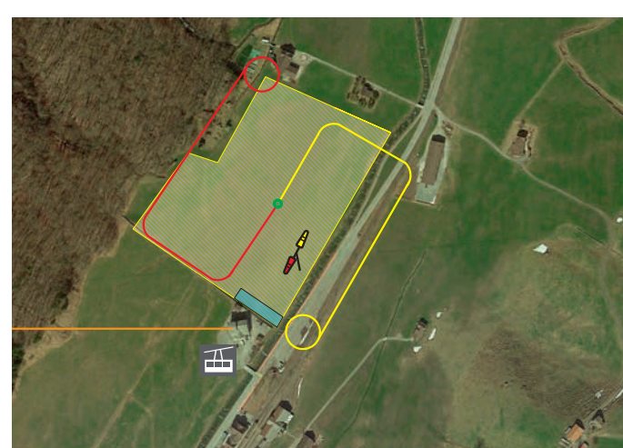
A1 Delta Wasserlauben